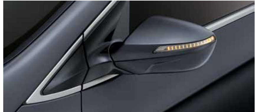
Außenspiegel in Wagenfarbe, elektrisch anklappbar und mit integriertem Blinker