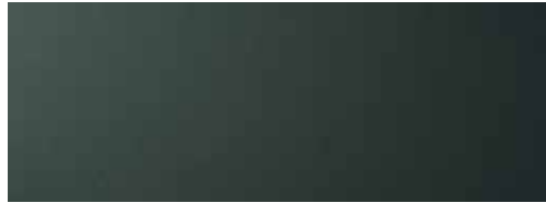
Rain Forest Metallic 1