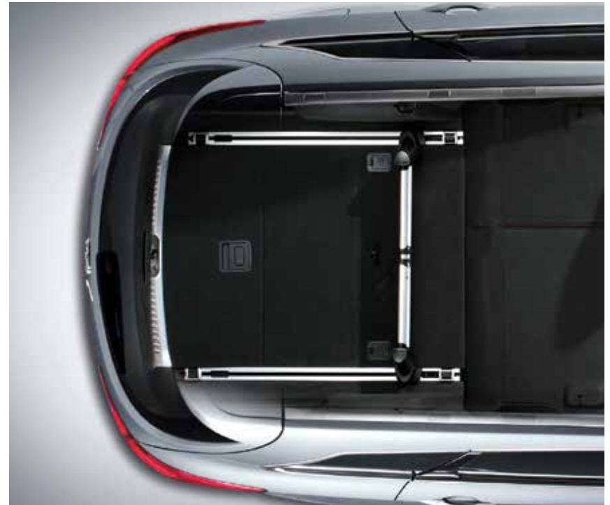
Gepäckraumordnungssystem mit stufenlos verstellbarer Trennstrebe 1