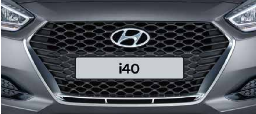
Kühlergrill im neuen Design – Mattierung