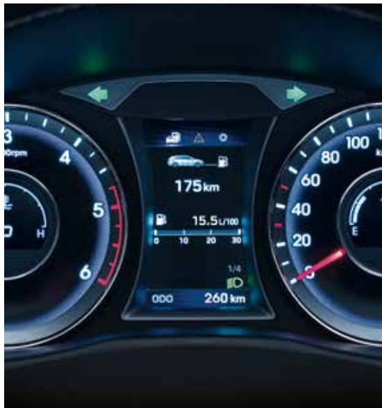
Bordcomputer mit Farbdisplay 1