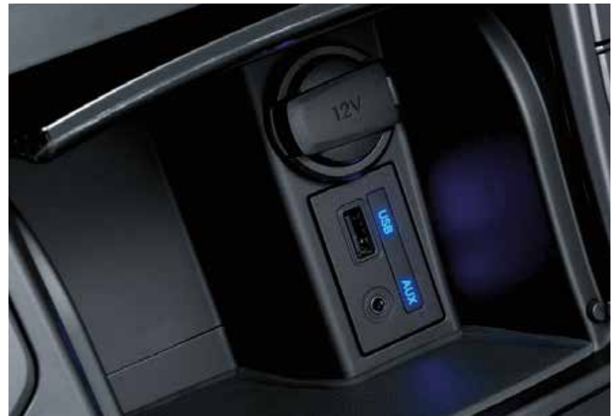
12-V-, AUX- und USB-Anschluss