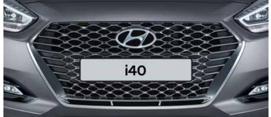
Kühlergrill im neuen Design – Chrom 1