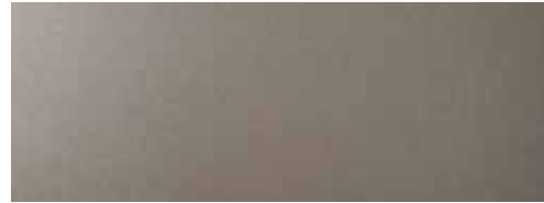
Earthy Bronze Metallic 1