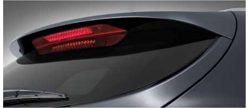
Heckspoiler mit integriertem Bremslicht