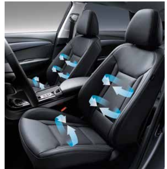
Belüftete Sitze 1