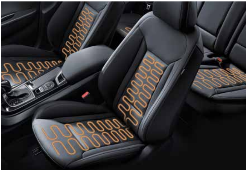
Sitzheizung vorne und hinten 1

Der Hyundai i40 Space schafft eine perfekte Verbindung aus alltagstauglicher Dynamik und herausragendem Komfort. Seine hochwertig verarbeiteten Materialien, zahlreiche Wohlfühl-Features sowie die elektronische Fahrwerksregelung an der Hinterachse machen das Fahrerlebnis zu einem ganz besonderen. Dank seines umfassenden Raumangebots und einer Vielzahl an Assistenzsystemen ist der Hyundai i40 Space für jedes Abenteuer zu haben. Er ist mit vier verschiedenen Motorisierungen erhältlich, als Benzin-er sowie als Diesel. Und das Beste: Dank der neuesten Hyundai Motorentechnologie, die schon jetzt dem 6d-TEMP-Standard entspricht, fahren Sie mit dem Hyundai i40 Space der Zeit voraus.