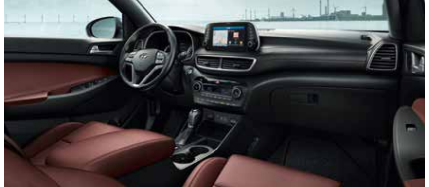
Innenausstattung in Rot mit Dachhimmel in Schwarz