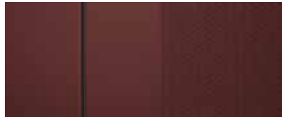
Leder in Rot 1,2