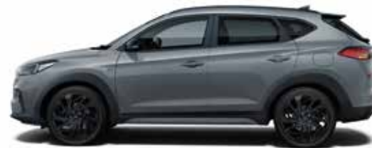
Shadow Grey Uni 1,4