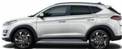
Platinum Silver Mineraleffekt 1