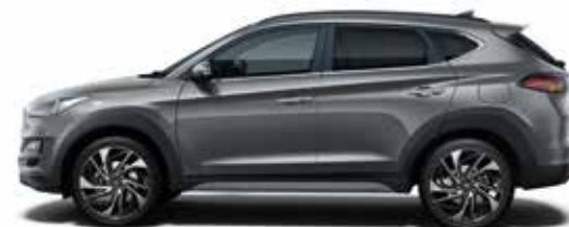
Micron Grey Metallic 1