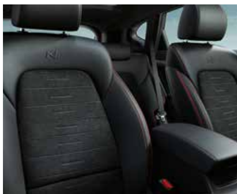
Sport-/Komfortsitze in Stoff-Leder-Kombination mit roten Ziernähten und N Logo.

Erleben Sie die sportliche Welt der N Serie in Form eines komfortabel dynamischen SUV. Die speziell entwickelten N Line Sport-/Komfortsitze sorgen für hervorragenden Sitzkomfort sowie optimalen Seitenhalt bei dynamischer Fahrweise. Das N Logo auf dem Lederschaltknäuf und die roten Ziernähte auf Sitzen, Armaturenbrett und Mittelarmlehne sorgen für einen dynamischen Look. Auch das N Line Lederlenkrad fügt sich mit dunklen Metallspeichen und roten Ziernähten fließend in das sportliche Gesamtbild ein und bietet mit perforierten Lederapplikationen optimalen Halt.