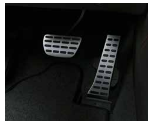
Pedale in der Optik von gebürstetem Aluminium mit Gumminoppen für besseren Halt.