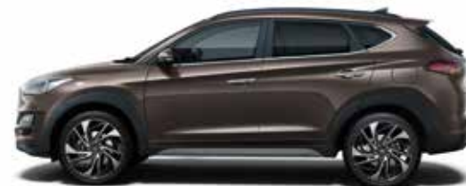
Moon Rock Metallic 1