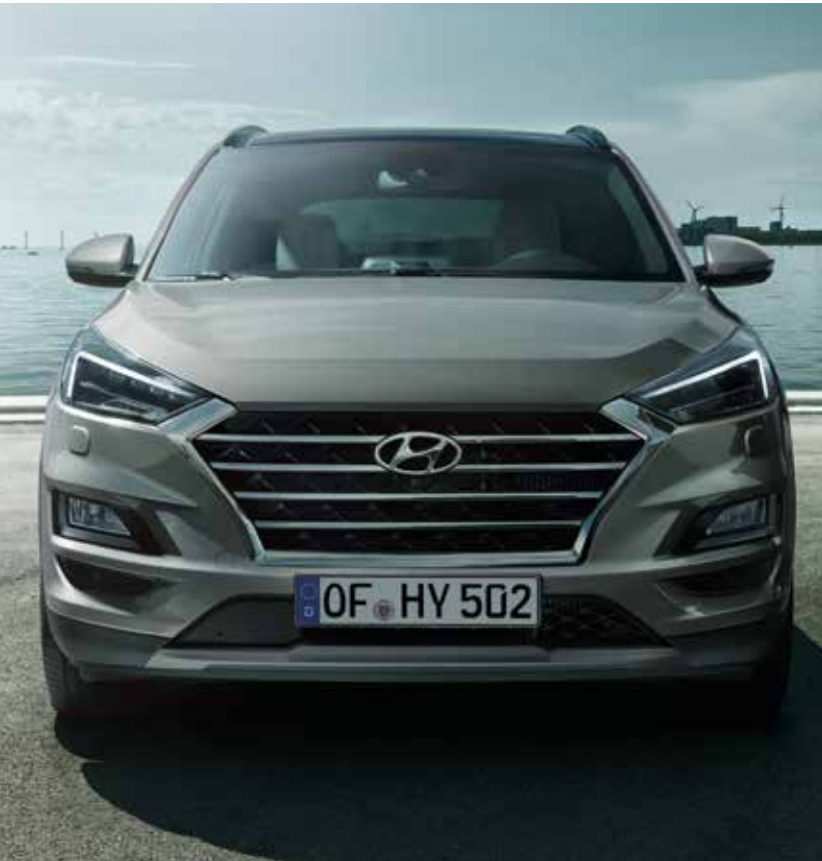
Neu gestaltete Frontpartie mit Kaskadenkühlergrill.

Die neu designten Voll-LED-Scheinwerfer verleihen dem neuen Hyundai Tucson ein markantes Äußeres und noch mehr Sportlichkeit. Sie gehen fließend in den oberen Teil des neuen Kaskadenkühlergrills über, das Herzstück der neu gestalteten Frontpartie. Stoßstange und Heckschürze wurden ebenfalls überarbeitet, um den dynamischen Auftritt noch zu verstärken. So hebt sich der neue Hyundai Tucson immer und überall von der Masse ab. Sie werden sich also an viel Aufmerksamkeit gewöhnen müssen.