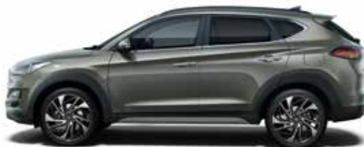
Olivine Grey Metallic 1