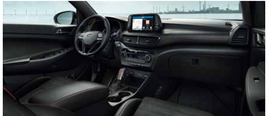
Innenausstattung für N Line in Schwarz mit roten Ziernähten