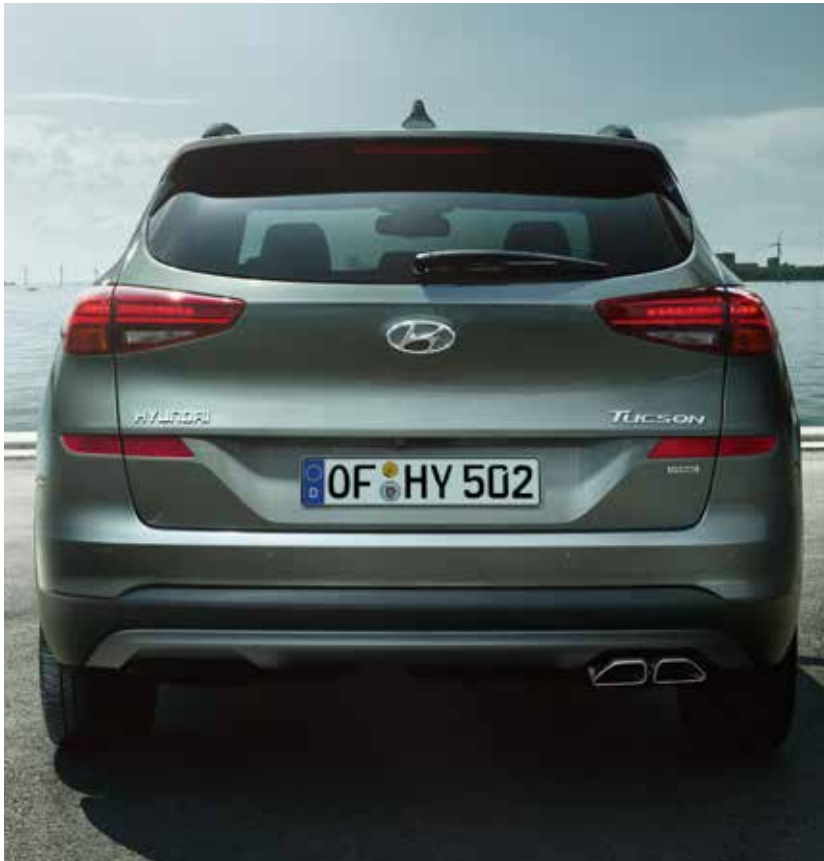
Neu gestaltete Heckschürze und LED-Rückleuchten¹.