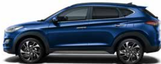
Stellar Blue Metallic 1,3