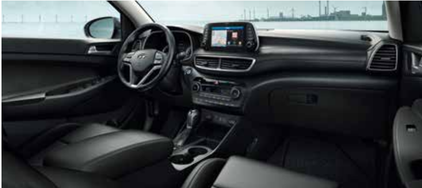
Innenausstattung in Schwarz mit Dachhimmel in Grau