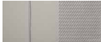
Leder in Grau 1,2