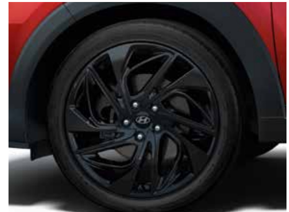
N Line Logo über den vorderen Kotflügeln. 19-Zoll-Leichtmetallfelgen in Schwarz.