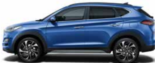
Champion Blue Metallic 1,3