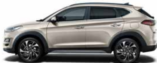
White Sand Metallic 1,3