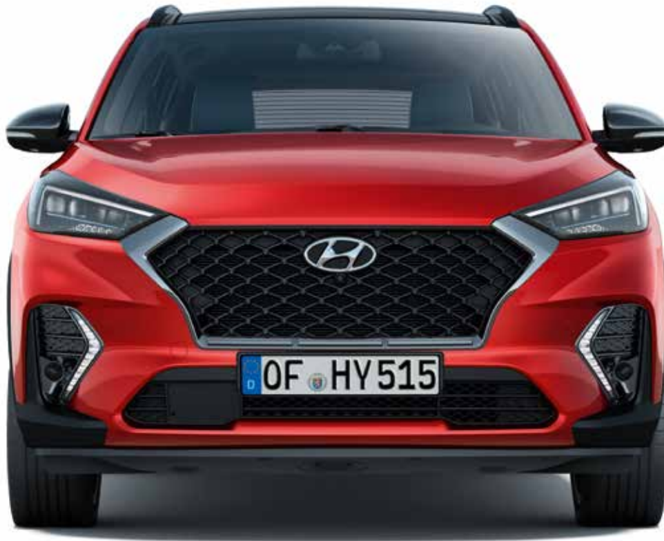
Die spezielle N Version des Hyundai Kaskadenkühlergrills und das LED-Tagfahrlicht in Bumerang-Form prägen die Frontansicht.

Ausgestattet mit vielen exklusiven Features, präsentiert sich der Hyundai Tucson in der Ausstattungsvariante N Line selbstbewusst-sportlich.