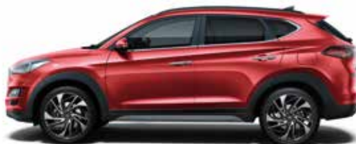
Fiery Red Metallic 1