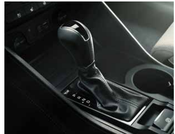
6-Gang-Schaltgetriebe 7-Gang-Doppelkupplungsgetriebe (DCT) und 8-Stufen-Automatikgetriebe (AT)