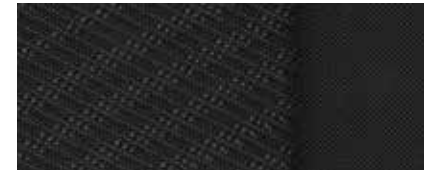
Stoff in Schwarz 1