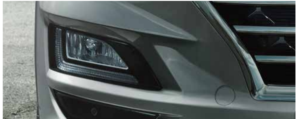
Nebelscheinwerfer und LED-Tagfahrlicht.