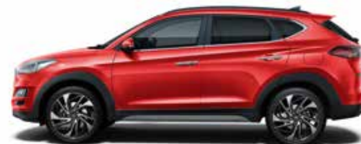
Engine Red Uni