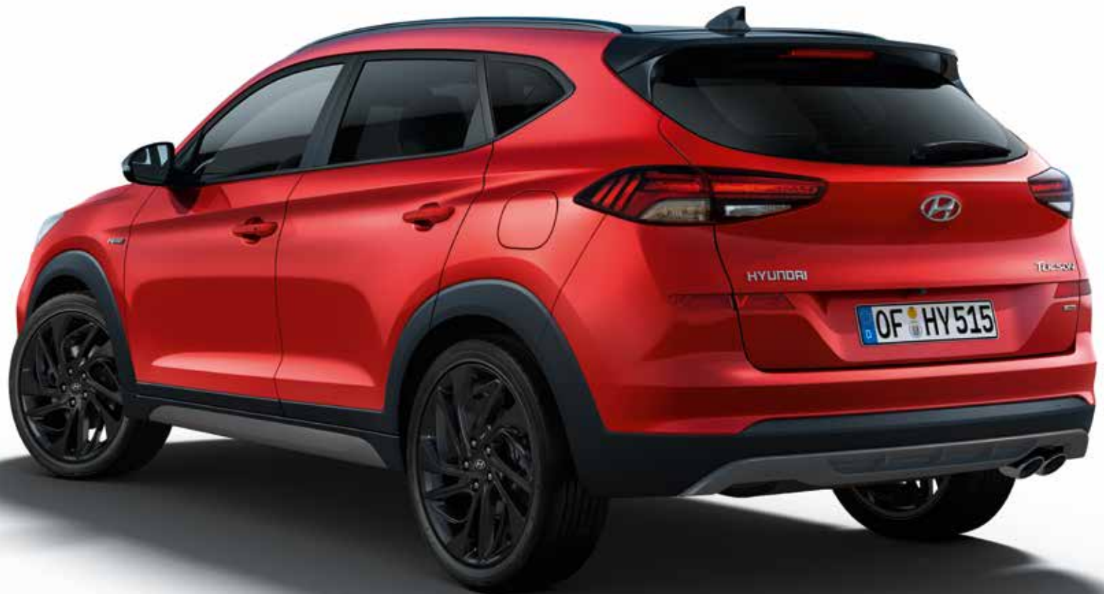
Aerodynamischer Heckspoiler, Dachreling, Außenspiegel und Haifischantenne in Schwarz. Abgasanlage mit ovaler Doppelendrohrblende.