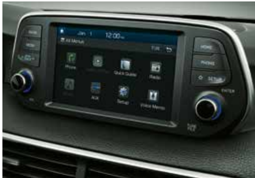
7-Zoll-Touchscreen¹ mit digitalem Radioempfang (DAB+), Apple CarPlay™ und Android Auto™.