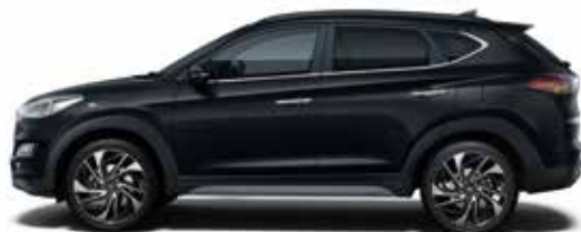
Phantom Black Mineraleffekt 1