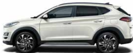
Polar White Uni 1