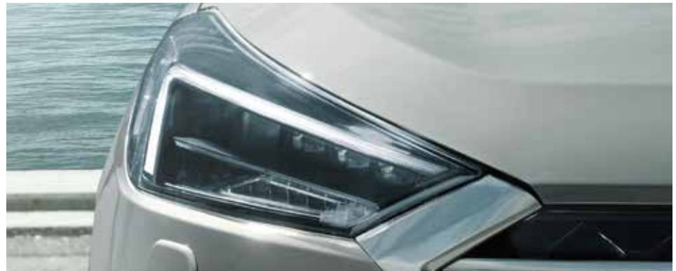
Voll-LED-Scheinwerfer mit Fernlichtassistent 1 .