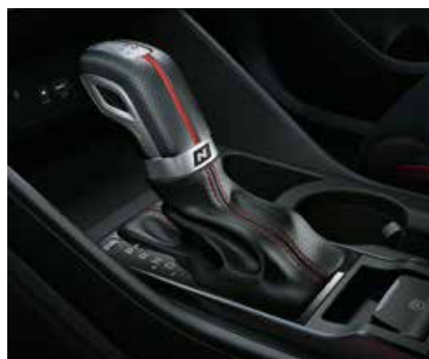
N Line Schaltknäuf mit Metallakzenten, roten Ziernähten und Lederapplikationen.